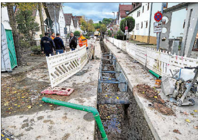
Verlegung neuer Wasserleitung in Blumenstraße

Aufgrund der Teilerneuerung des Trinkwassernetzes mussten die Arbeiten in der Blumenstraße abschnittsweise erfolgen. Dabei wurden die vorhandenen Altleitungen aus Grauguss mit langlebigen und hochwertigen Kunststoffleitungen ersetzt und die Hausanschlüsse jeweils umgebunden. Durch den Austausch können deutliche netzhydraulische und damit auch versorgungstechnische und betriebliche Verbesserungen erzielt werden.