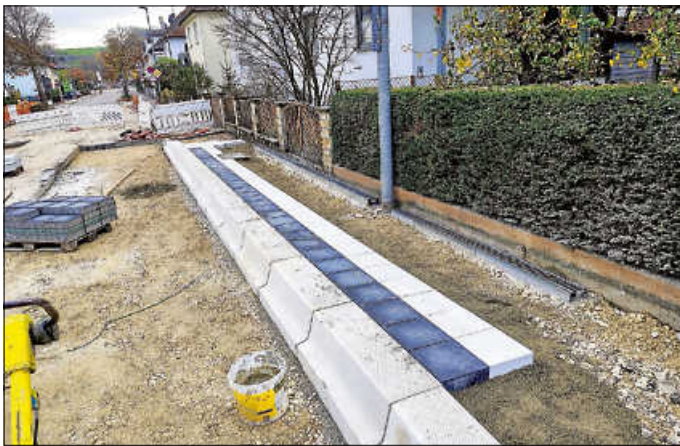
Barrierefreier Umbau Haltestelle Blumen-/Wilhelmstr.

Aufgrund der Teilerneuerung des Trinkwassernetzes mussten die Arbeiten in der Blumenstraße abschnittsweise erfolgen. Dabei wurden die vorhandenen Altleitungen aus Grauguss mit langlebigen und hochwertigen Kunststoffleitungen ersetzt und die Hausanschlüsse jeweils umgebunden. Durch den Austausch können deutliche netzhydraulische und damit auch versorgungstechnische und betriebliche Verbesserungen erzielt werden.