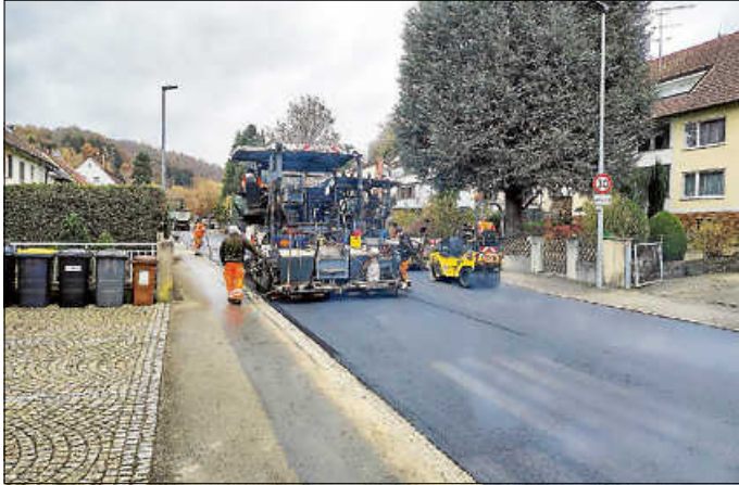
Deckbelageeinbau in Blumenstraße

Die Sanierungsarbeiten entlang der Blumen- und Schorndorfer Straße konnten innerhalb der geplanten Bauzeit am 22.11.2024 fertiggestellt werden. Während der ca. viermonatigen Bauphase wurden neben der reinen Deckbelagssanierung alle acht Bushaltestellen entlang der Landesstraße barrierefrei durch die Gemeinde, mit dem Ziel der Stärkung und Weiterentwicklung des kommunalen Mobilitätsangebots für alle Nutzergruppen, umgebaut. Die Wartehäuser werden aktuell noch gefertigt und zeitnah aufgebaut.