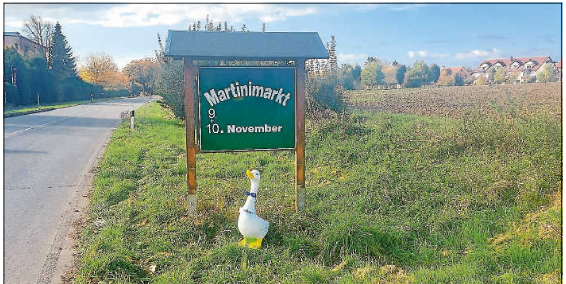
Näheres im Innenteil.