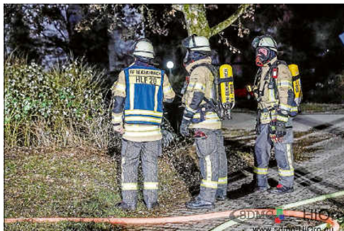
Einsatz 7 - Brand eines Holzunterstandes an Gebäude