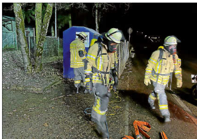
Einsatz 3 - brennender Altkleidercontainer