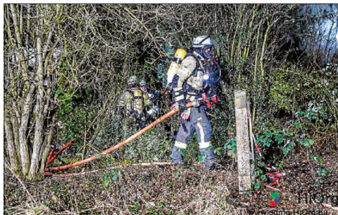
Einsatz 7 - Brand eines Holzunterstandes an Gebäude