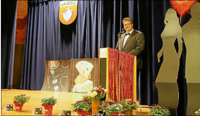
Der Croupier des Seniorenachmittages unter dem Motto Casino Royale.