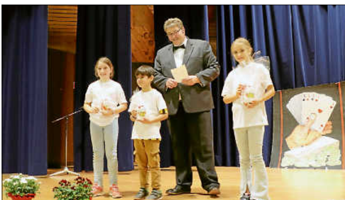
Die Kids der GTS mit dem Preis für das James Bond -Quiz.