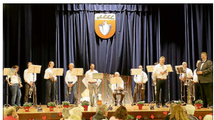
Der Posaunenchor sorgte für musikalische Stimmung.