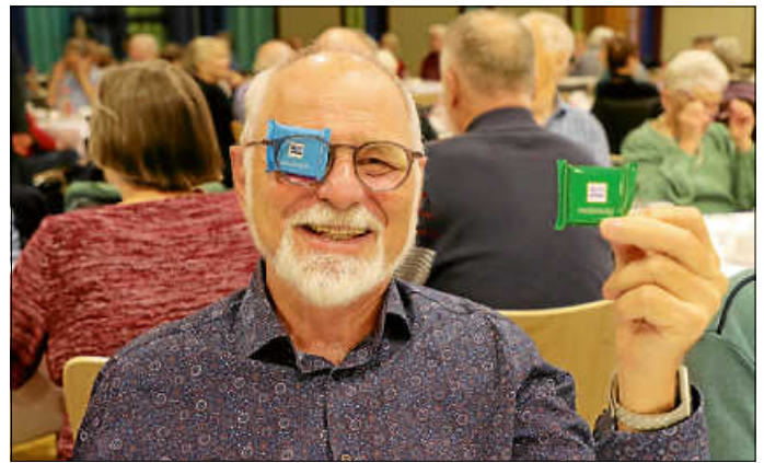
Die Schokolade hat sichtbar geschmeckt.