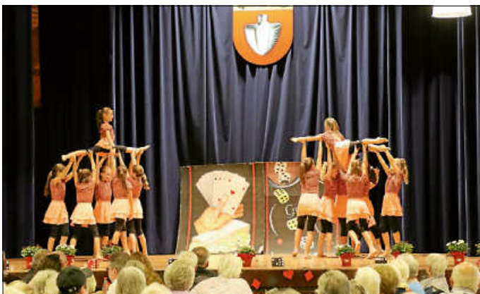
Akrobatische Showeinlage der Picafloras.