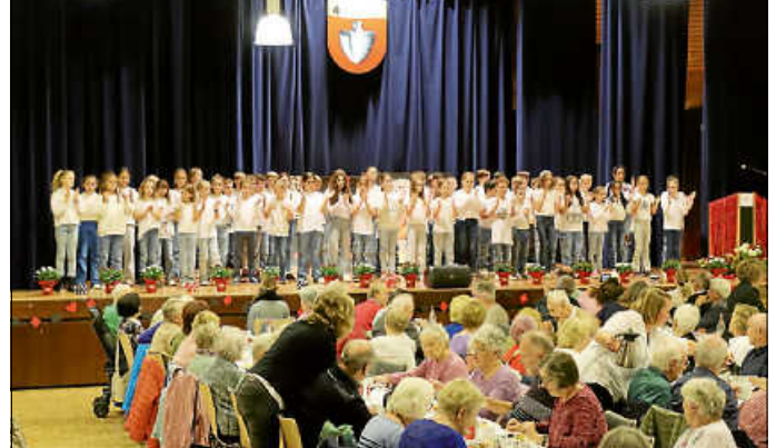
„Full House“ mit den Klassen der Lützelbachschule und Realschule.