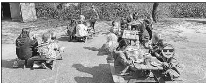
Ein leckerer Snack vorab zur Stärkung

Sichtlich hatten die Kinder an diesem Tag viel Freude damit und werden dies auch mit Sicherheit in der kommenden Zeit haben. Wir bedanken uns bei den letztjährigen Vorschulkindern für die Mithilfe bei der Einweihung und freuen uns immer auf ein kleines Besuchle :-)