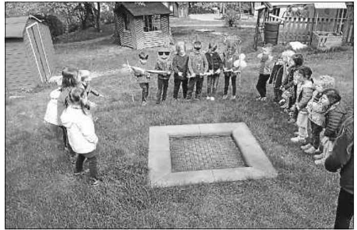
Die „alten“ Vorschul Kinder durchtrennen gemeinsam das Band

Das Team & die Kinder vom Kinderhaus Kunterbunt