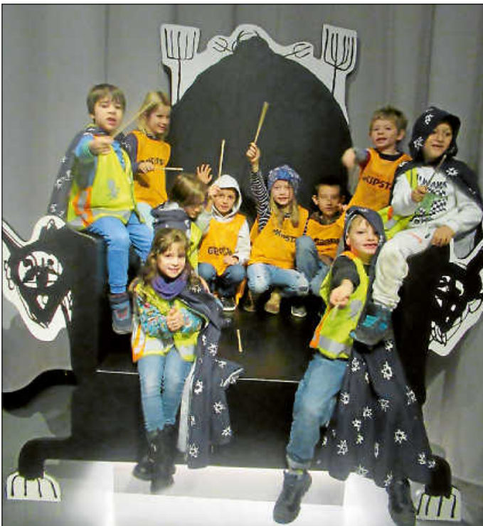
Tolle Mitmachaktionen im Jungen Schloss Stuttgart bei der Ausstellung „Die kleine Hexe“, Otfried Preußler

Höhepunkt der mystischen Woche war dann die alljährliche GTS Halloweenparty mit 70 Kindern aus ganz Reichenbach.