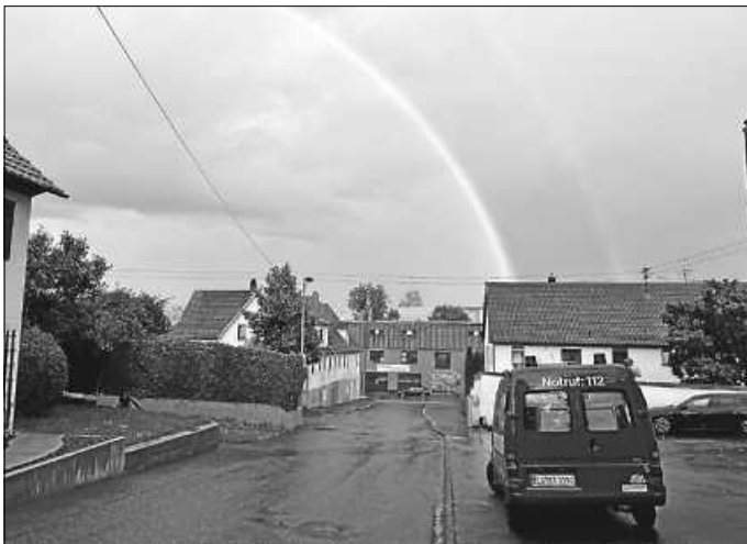
Am Ende des Regenbogens steht ein ELW