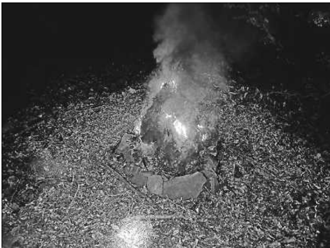
brennender Kleiderhaufen mitten im Wald