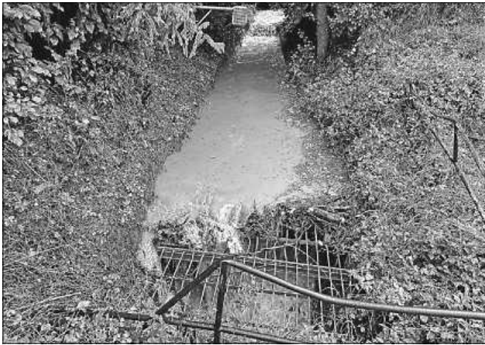
Frühwarnsystem meldet hohen Pegel