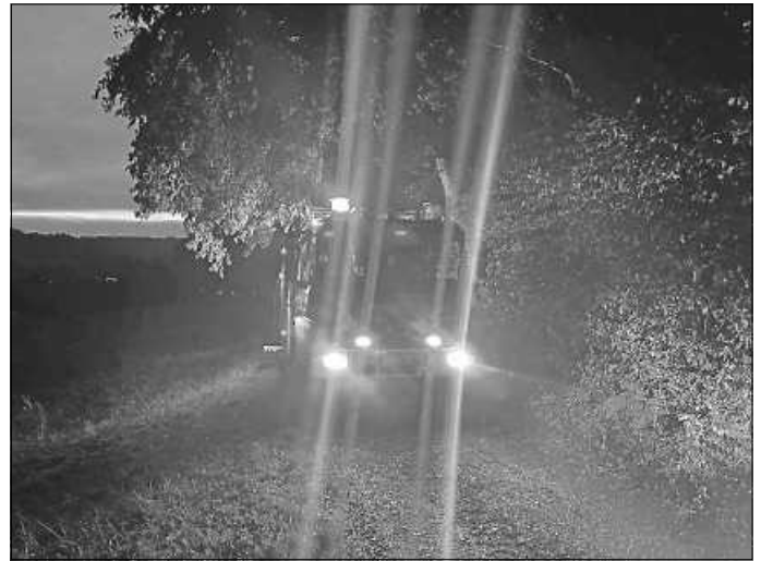
LF16/12 löscht Feuer im Wald