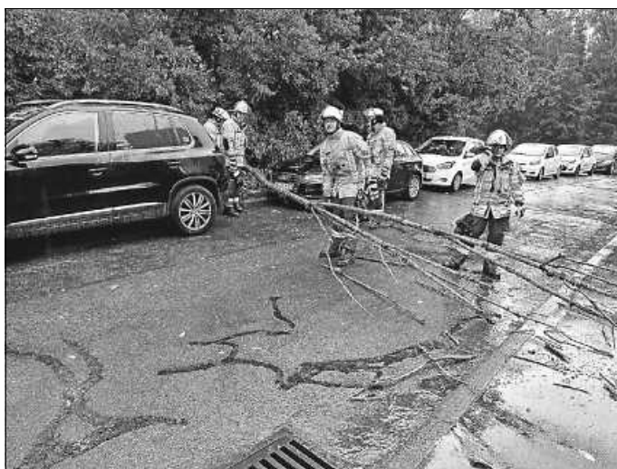
Kleinerer Baum wurde bei Sturm entwurzelt