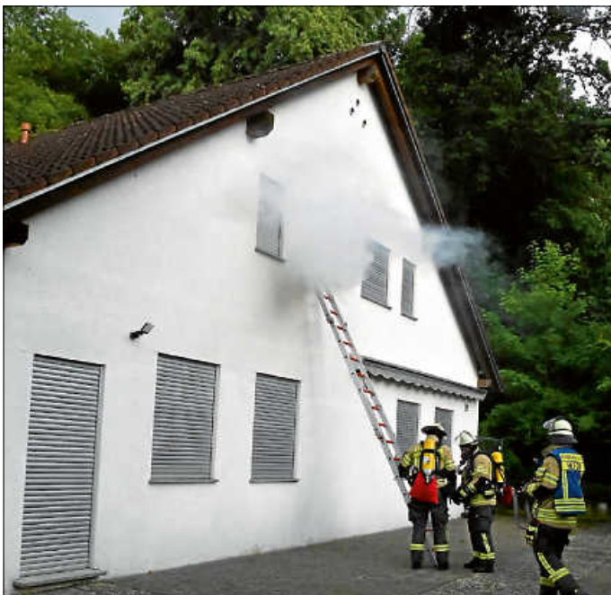
Aus dem Vereinsheim „Rädle“ dringt dichter Rauch