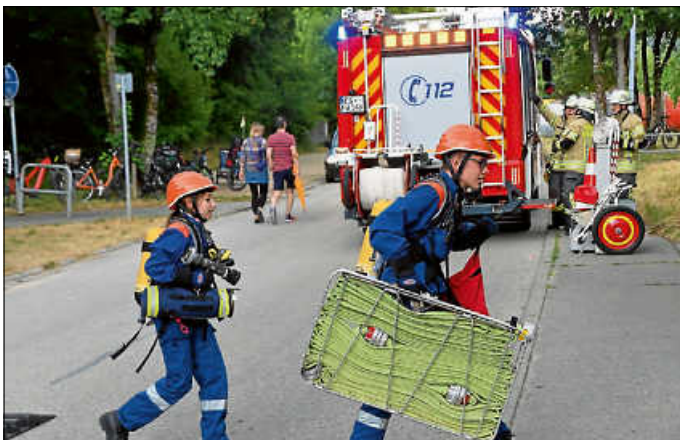
Die Jugendfeuerwehr mit ihrem Atemschutzatrappen