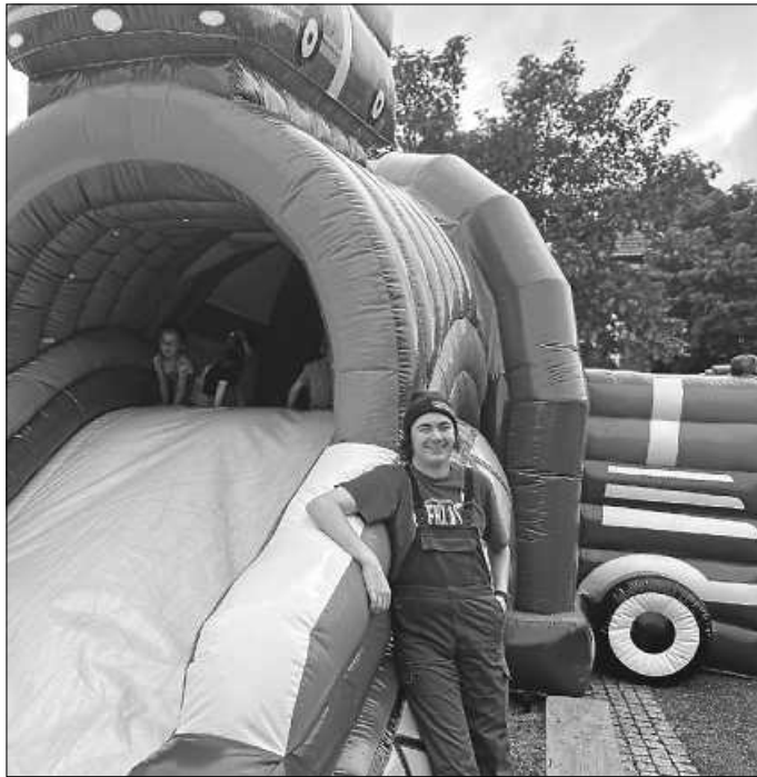
Neues Highlight für die „Kleinen“ war unsere Hüpfburg