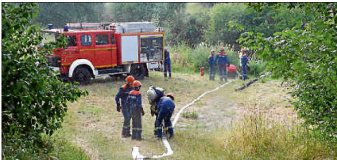
Die Jugendfeuerwehr holt Wasser von der Fils