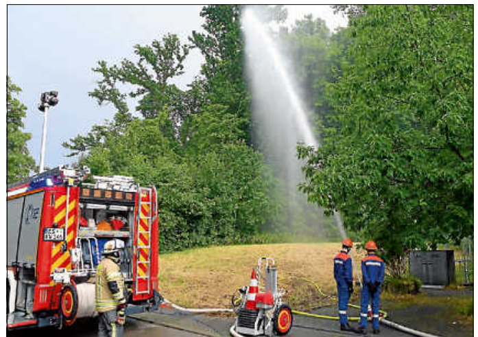
Ein Wasserwerfer wird in Stellung gebracht