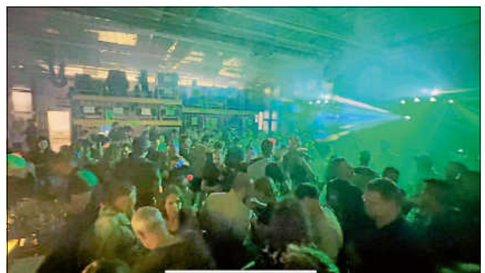
Die Spritz-Bar war bis zum Festende gut besucht