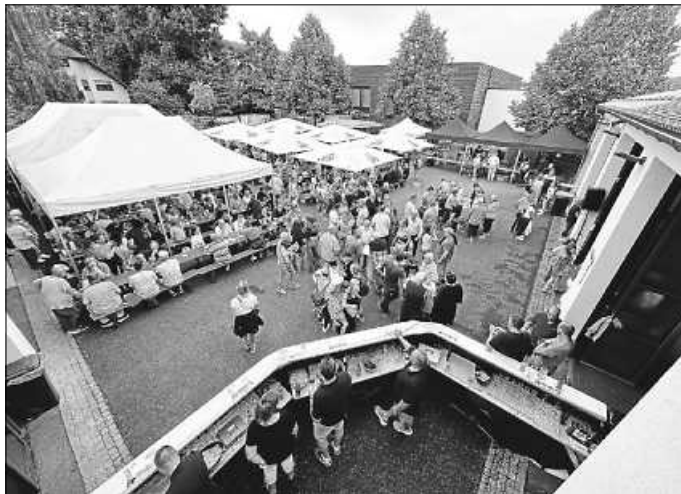
Alle Plätze waren belegt!