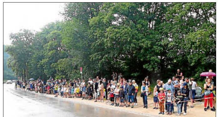
Wir bedanken uns wieder für Ihr großes Interesse