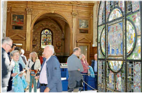
Beeindruckt zeigten sich alle von den Kirchenfenstern und dem Einblick in Glasmalerei in der Cité du Vitrail in die Kunst der Troyes