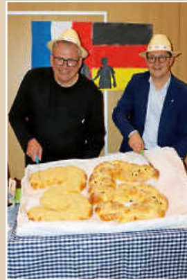
die dann auch noch beim Anschneiden der Reichenbacher Hefezöpfe in Form einer 35 getragen wurden.