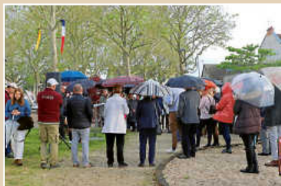
Ein kurzer Regen trübte die gute Stimmung der gemeinsamen Tage nicht