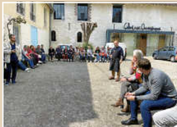
Die Verköstigung mit Prunelle de Troyes fand im Freien statt