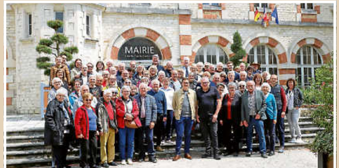
Das obligatorische Gruppenbild vor der Abreise