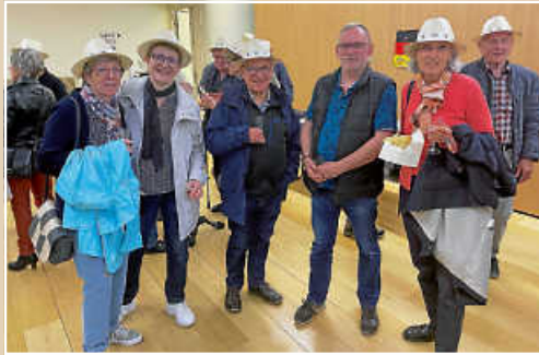
Die Reichenbacher Freunde wurden mit Partnerschaftshüten begrüßt, ...