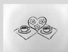
Grafik: M. Ehrenfeuchter

Der September ist diese magische Zeit, in der man mit einem Sonnenbrand auf dem Balkon sitzen und Lebkuchen essen kann. (unbekannt)