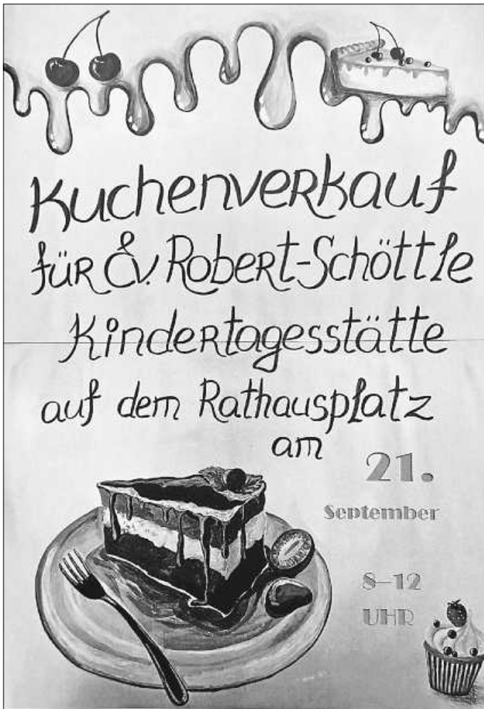
Plakat: A. Kienzlen