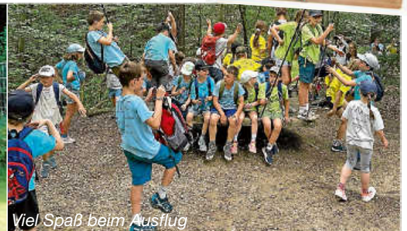
Viel Spaß beim Ausflug