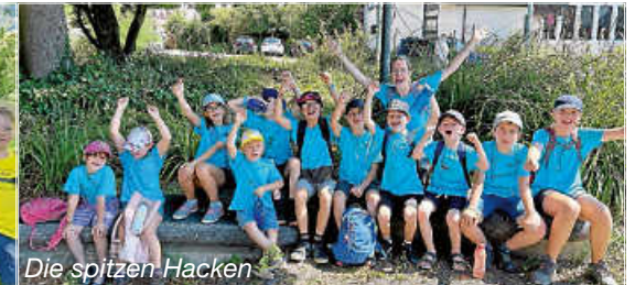
Die spitzen Hacken