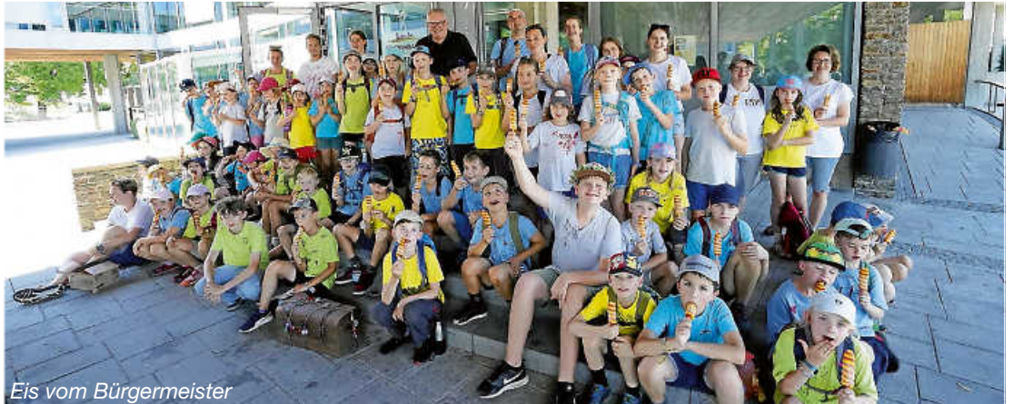
Eis vom Bürgermeister