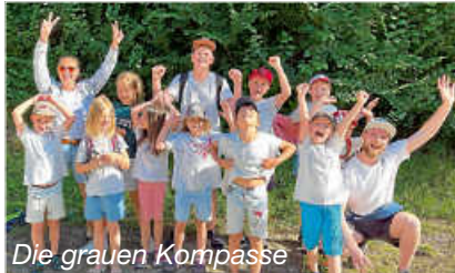
Die grauen Kompassse