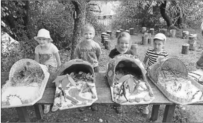
Unsere Vorschulkinder mit ihren Abschlussarbeiten: Pferdestall und Dinosaurierhöhle

Als Nächstes wurden stolz die Abschlussarbeiten präsentiert. Unsere Vorschulkinder haben aus einer Holzplatte etwas ganz Besonderes gebaut. So konnten alle Fähigkeiten, die im Kindergarten erlernt wurden, angewendet werden, und eine schöne Erinnerung an die Zeit im Waldkindergarten wurde geschaffen.