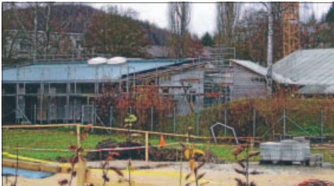
Blick von der Baustelle des Paul-Schneider-Hauses auf die Kinderkrippe

Nachdem im Mai Spatenstich und im September Richtfest gefeiert wurde, steht jetzt fest, dass die Kinderkrippe mit ihren 20 Plätzen voraussichtlich ab Oktober 2010 Kinder zwischen ein und drei Jahre aufnehmen wird.