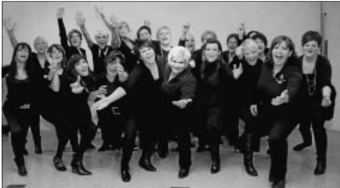
Das Team von Staib Friseure