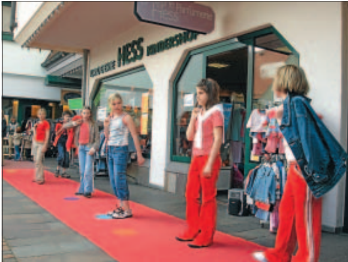
Modenschau von Kindershop Hess