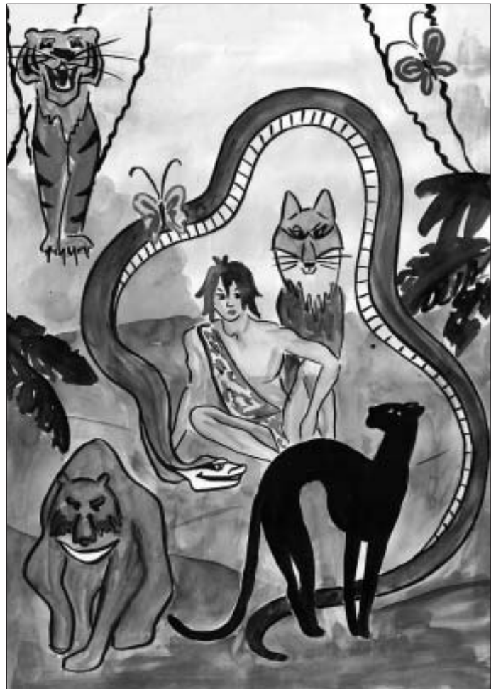
Über 100 Ballettschülerinnen und Schüler der Esslinger Ballettschule Khinganskiy sind bei dieser Aufführung dabei.

Am Sonntag, 1. Februar 2009 um 15 Uhr in der Brühlhalle zeigt die Ballettschule Khinganskiy und die Tanz-Theater Company Khinganskiy die Tanzaufführung "M O W G L I" nach R. Kipling "Das Dschungelbuch".