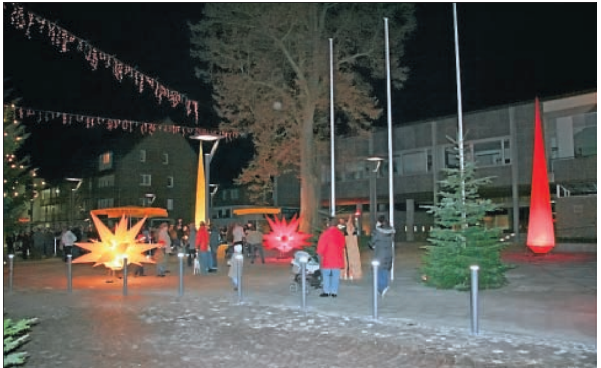
Reichenbach im "Lichterglanz" der Werbeinitiative Reichenbach WIR

"Wir sehen aufs alte Jahr zurück und haben neuen Mut. Ein neues Jahr, ein neues Glück, die Zeit ist immer gut." Hofmann von Fallersleben