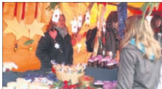
Fortsetzung im Innenteil Lichtenwald

Wöchentliches Nachrichtenblatt vom unteren Filstal und vom Schurwald