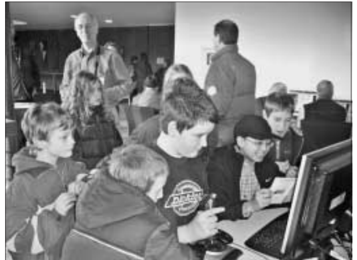
Begeisterte Jugendliche vor den PCs von Senioren online

Außerdem präsentierte "Senioren online" ihre aktuellen Projekten und interessierte Gäste konnten in die Computer-Welt eintauchen. Besondere viele Zuschauer betrachteten die Diaschau von dem Hochwasser im Juni dieses Jahres.