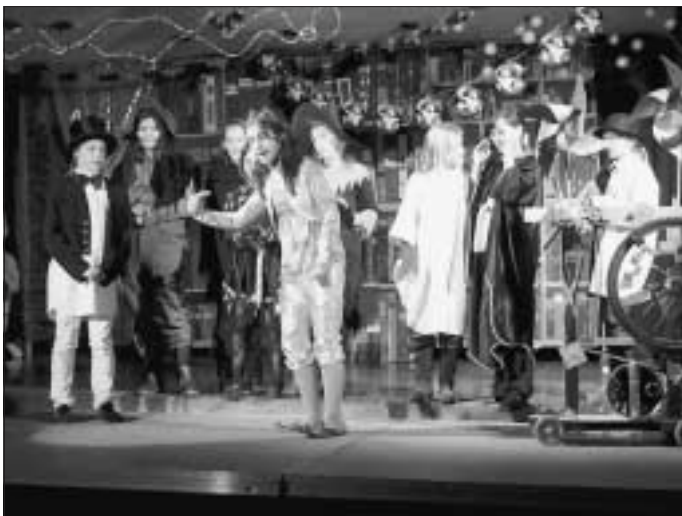
Die Schauspielerinnen in Aktion